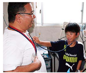
お医者さん になったみたい