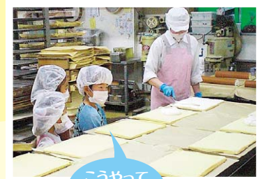
こうやって つくるんだ

こどもが保護者の職場を訪問することです。 この取組により、誰もが大事な家族や生活があることを社内全体で再認識することができます。また、ワーク・ライフ・バランス（仕事と生活の調和）を進める職場の雰囲気が生まれます。