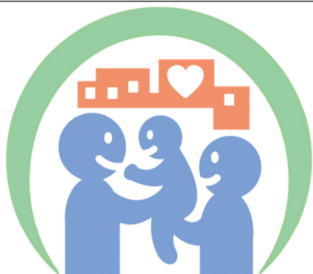
仕事と家庭の両立支援 広島県登録マーク